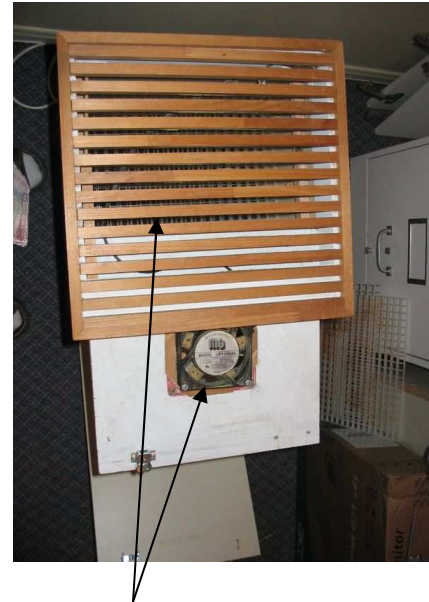
Ventilateur et grille de sortie