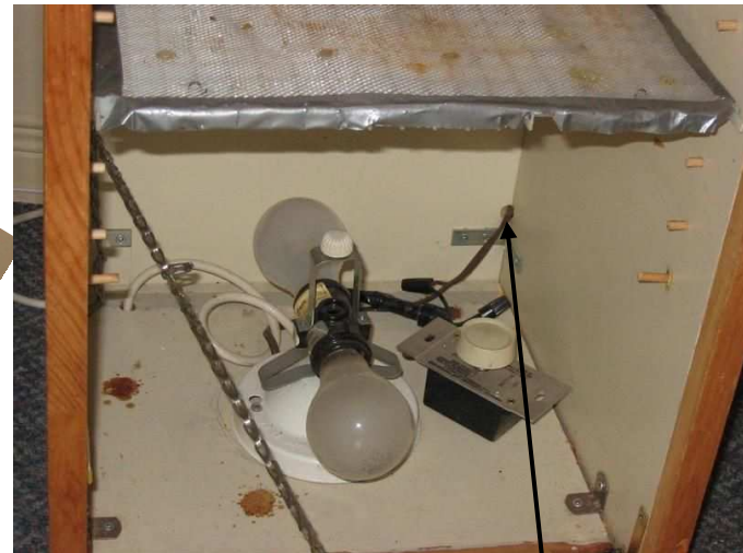
Fils électrique du ventilateur